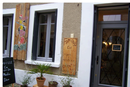
Entrée de "Fripouille et Cie"

L'adresse : 5 rue de la Vieille Église , à Saint-Clar