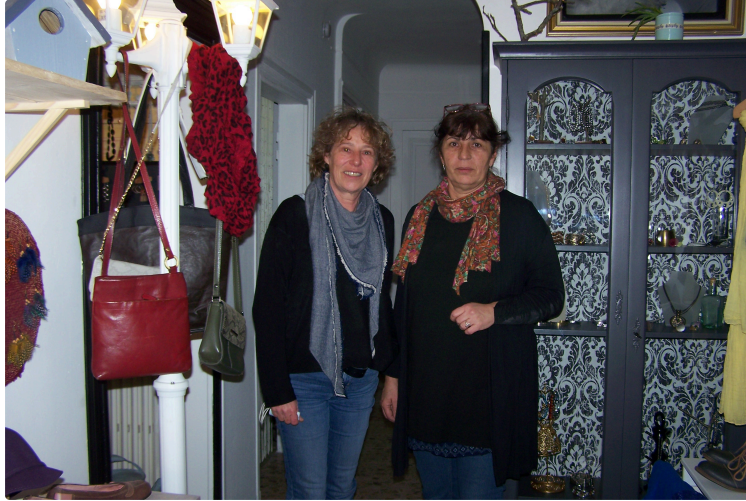
Deux sœurs réunies dans un lieu authentique