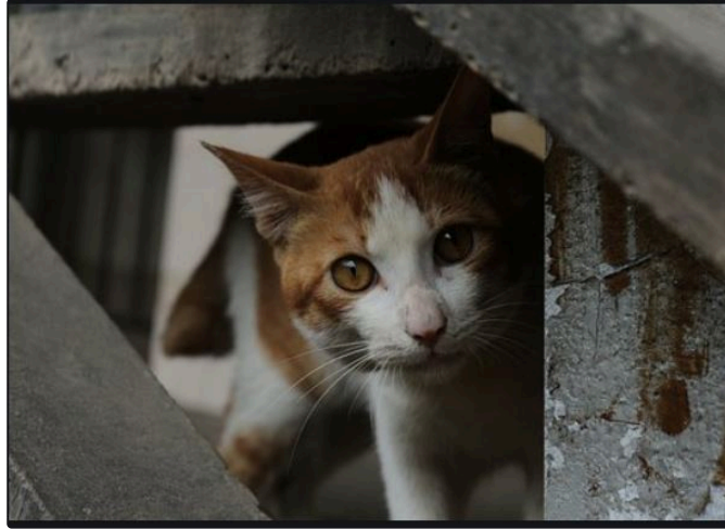
Stérilisation des chats errants