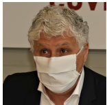
Philippe Martin président du conseil départemental du Gers

"Nous avons engagé un dispositif de proximité avec notamment 740 injections par semaine puis 1440 . On va continuer à augmenter pour aller à 3000 injections hebdomadaires, et le nombre de jours d'ouverture des centres va aussi augmenter pour pouvoir absorber les flux. Le SDIS 32 est engagé dans chaque centre de vaccination . Nous avons une spécificité nationale, le centre de vaccination est appairé à un centre de secours et donc le dispositif est très résiliant ."