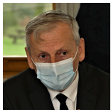
Jean René Cazeneuve député

"Les infos dont nous disposons nous permettent de réouvrir la réservation à compter de demain 9h. On va prendre les réservations autant pour une primo-injection que pour la seconde injection, pour les mois de février et de mars."