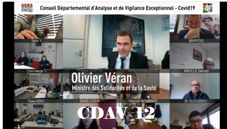
CDAV 12 : invité Olivier Véran ministre de la santé