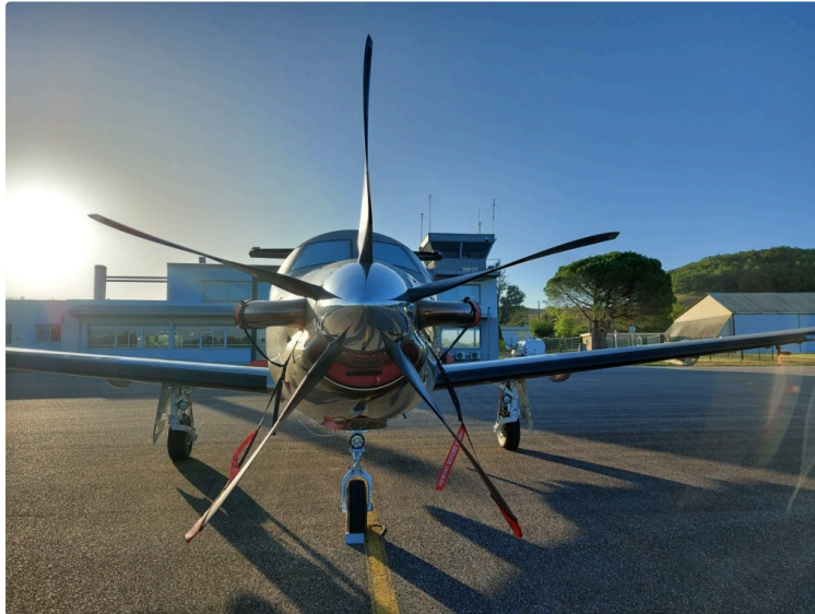
Aéroport d'Auch-Gers : un bon équilibre grâce à sa diversification

Malgré des zones de turbulences liées à la crise sanitaire, le site a réussi à éviter les trous d'air