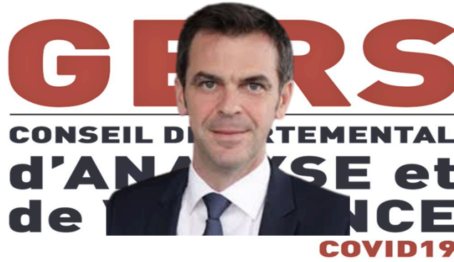
Olivier Véran prochain invité du CDAV 32