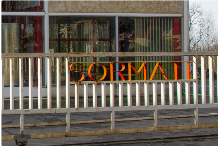
Sormati (Monclar-d'Armagnac) s'adosse à Liatech (Éauze)

D'où une force de frappe renforcée en matériel et dépannage viti-vinicole et en d'autres filières