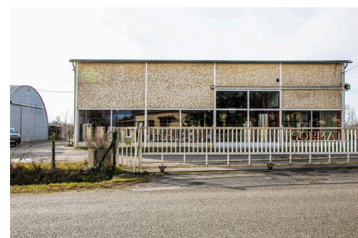
Bâtiment principal de la Sormati