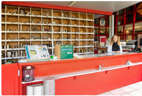
Le magasin de pièces détachées chez Sormati