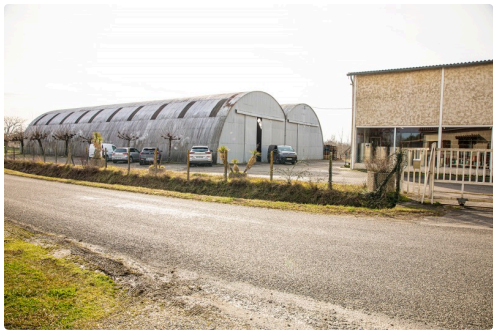
A droite: bât principal, à gauche atelier de la Sormati