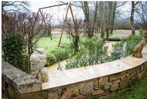
Le canal est de l'autre côté du mur