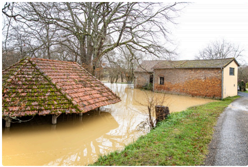
Vue générale avec le lavoir inondé au 1er plan