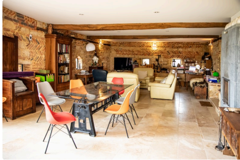
Pièce de séjour ex-salle des meules