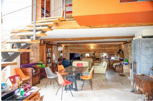
Les deux niveaux