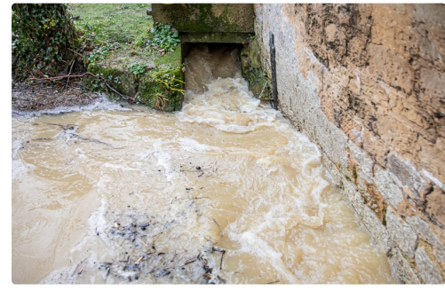
L'eau du Midour arrive à gros bouillons