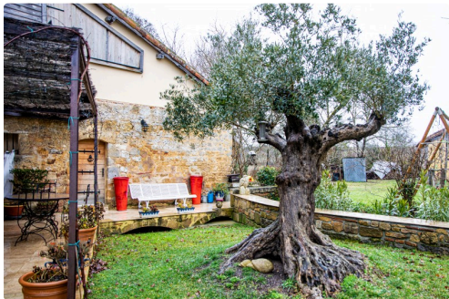
L'ancien bassin et les 2 bouches d'eau