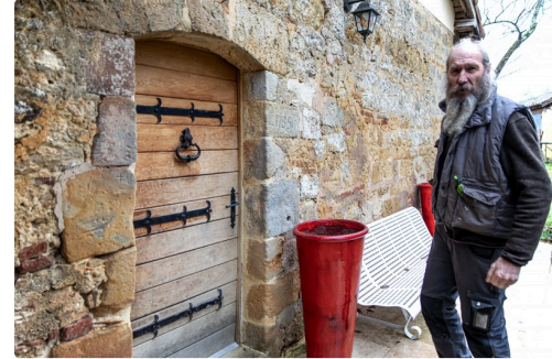
Une porte faite par Gérald Deturck