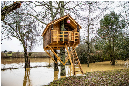
Cabane des petits-enfants construite par Gérald