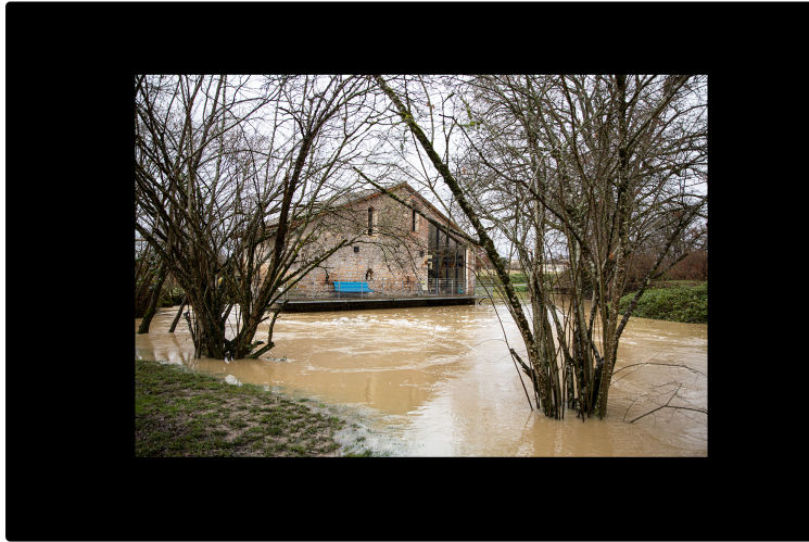
Un moulin à eau datant du Moyen-Âge à Nogaro (mis à jour le 01.02.2021)

Son propriétaire en a fait une superbe résidence