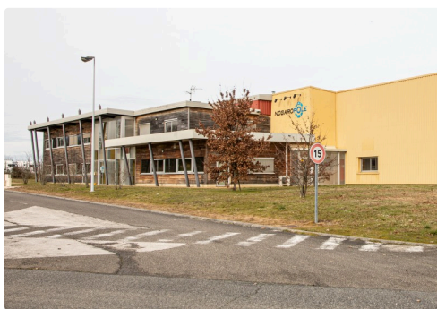
La pépinière du Nogaropole