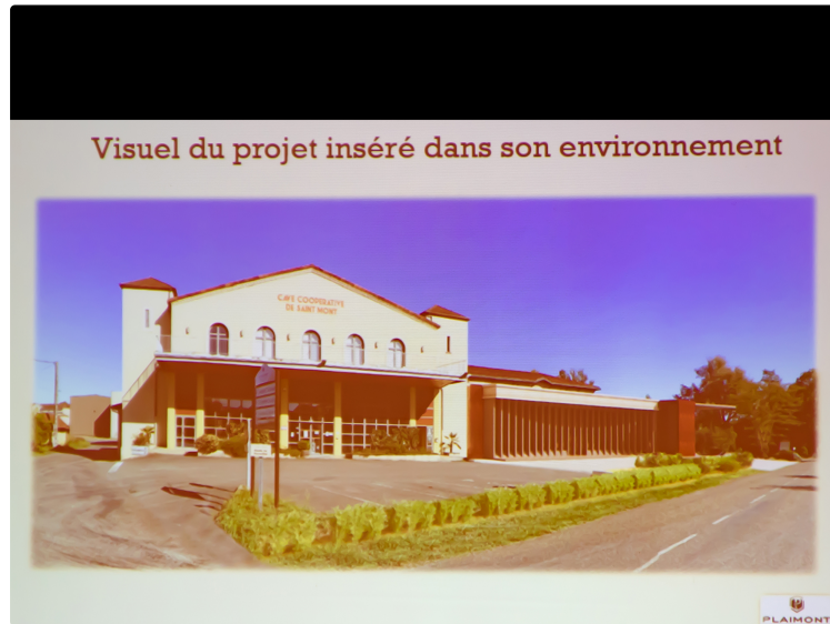
Ambitieux projet pour le Sud-Ouest de Plaimont à Saint-Mont

Plaimont Producteurs est ambitieux, on le savait. Puisque cette coopérative, partie de pas grand-chose en 1979, est devenue un acteur viti-vinicole et économique important et incontournable du Sud-Ouest.