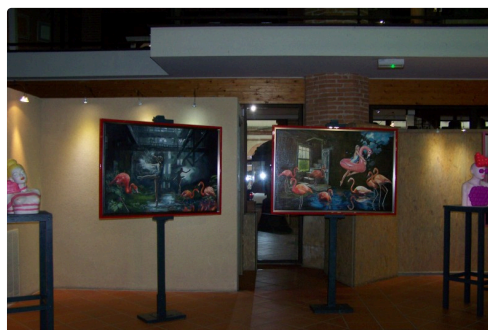
expo fresh réalité au Musée Campanaire 003.JPG