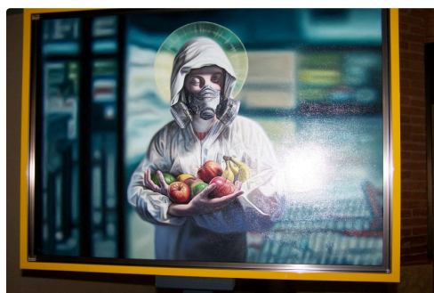
expo fresh réalité au Musée Campanaire 007.JPG