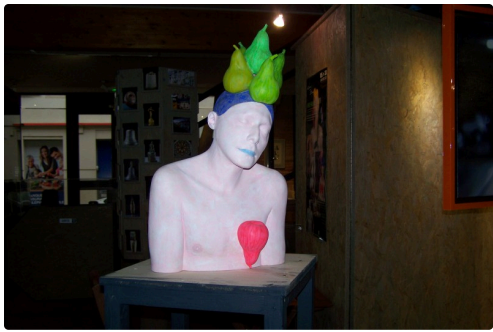
expo fresh réalité au Musée Campanaire 009.JPG