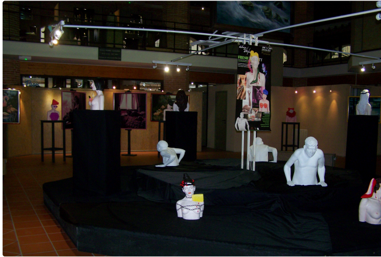
Au Musée d'Art Campanaire, une exposition installée mais sans public