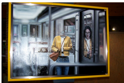
expo fresh réalité au Musée Campanaire 006.JPG