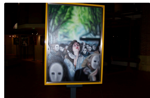
Réalisée par Dimitri Buiron, on est dans l'actualité !