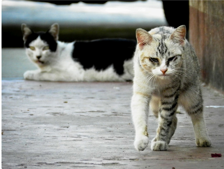
Lutter contre la prolifération des chats en ville

Un thème de campagne électorale qui se concrétise