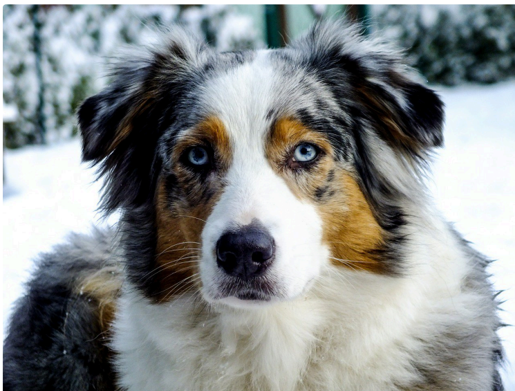
Une année record pour les chiens !

Pour découvrir les chiens préférés des Français, il suffit de se rapporter au nombre d'inscriptions au LOF.