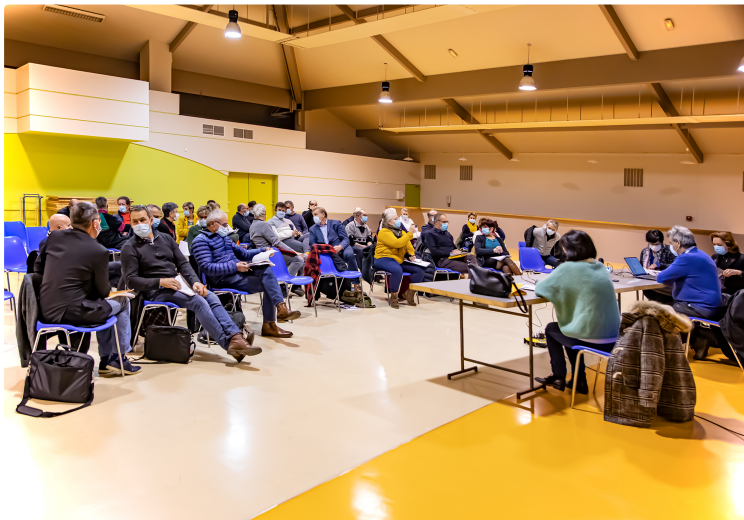
Du très nouveau sur le Très Haut Débit en Armagnac-Adour

Et le fisc crée les conseillers aux décideurs locaux