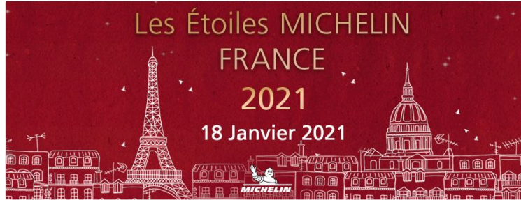
Le Michelin 2021 dévoilé

Quatre établissements gersois distingués