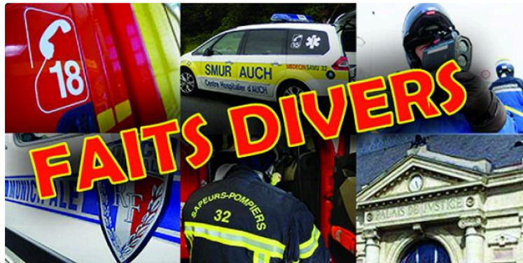
Gendarmerie du Gers : appel à témoins