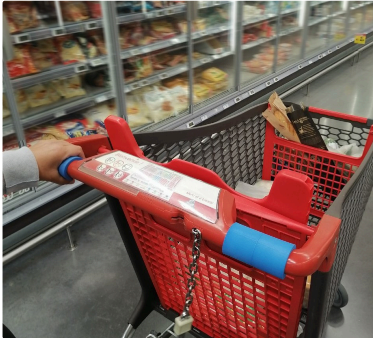
Les courses, d'accord, mais sans les virus

Poignéenet, les poignées en mousse adaptées aux chariots pour limiter leur propagation