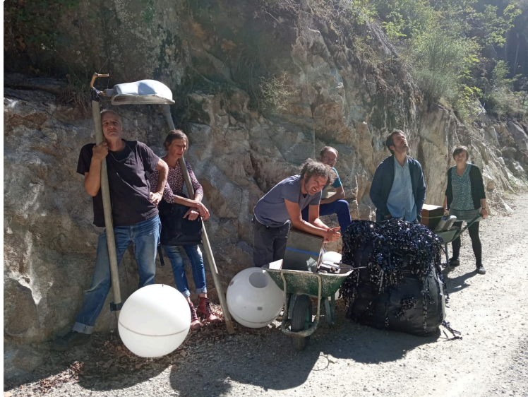
Vivre des émotions ensemble, le mot d'ordre de la compagnie Kiroul