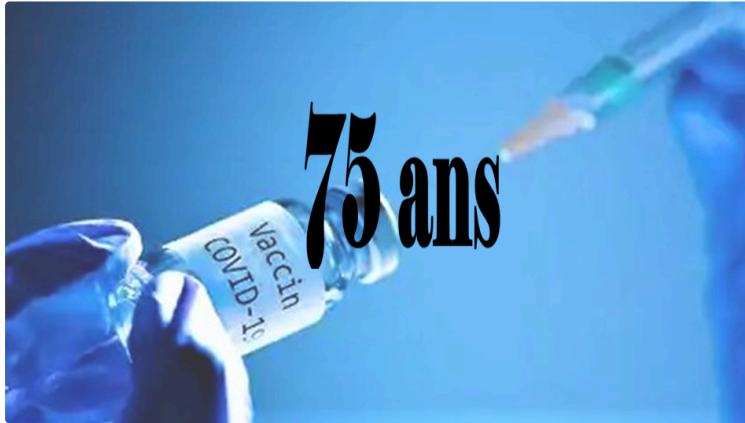
les plus de 75 ans , c'est à vous