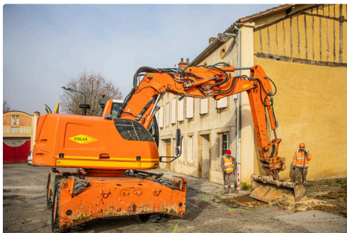
Travaux de terrassement aux arènes

Et ce n'est pas tout, au chapitre des travaux : les aménagements prévus à la salle d'animation pour créer une cuisine pédagogique seront lancés au dernier trimestre 2021.