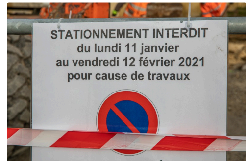
1 Panneau daté 1bis 110121.jpg