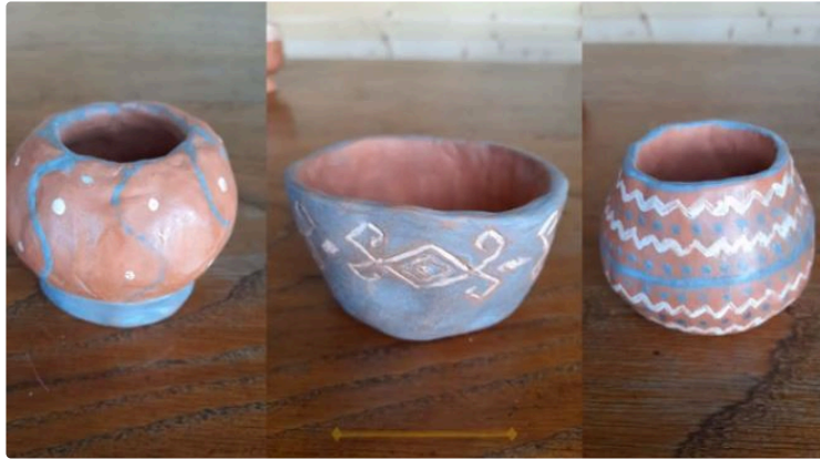
Après les azulejos, les collégiens découvrent les "huacos"