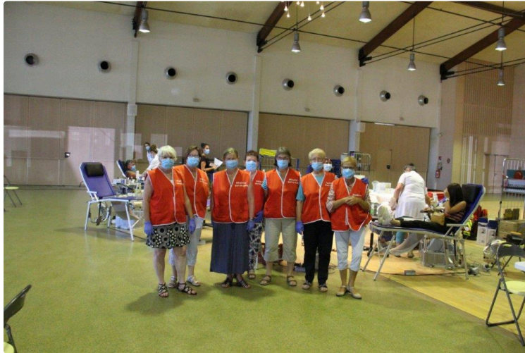
L'année masquée, une rétrospective en photos