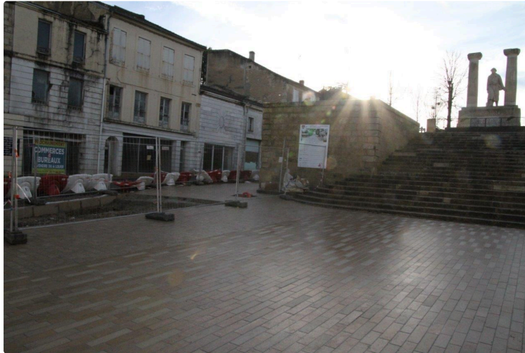
Une galerie commerciale, une première pour la ville