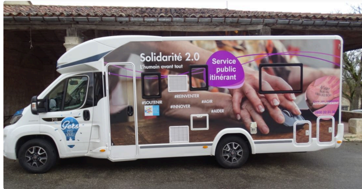
Je me teste, tu te testes, on s'en sort !