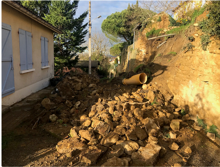
Violent incendie au Garros à Auch. Montesquiou, effondrement d'un mur de soutènement.