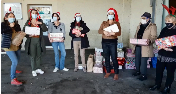
Succès des Boîtes de Noël

Les gersois encore une fois très généreux