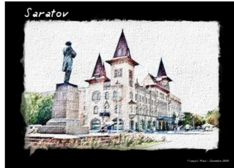
La fée, le lutin, la souris

Un nouveau conte de Noël de François Macé