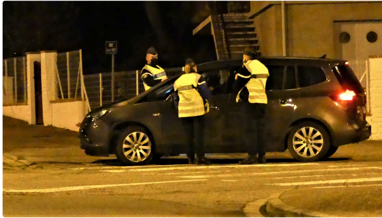
Contrôle couvre-feu et même plus

Xavier Brunetière, préfet du Gers, accompagné du colonel Jean-Luc Vezin, participait ce mercredi 30 décembre à compter de 20 heures, avec les forces de l'ordre à des contrôles routiers sur la commune de Gimont au rond-point de la sardine (RN 124 et D12). Ces contrôles se sont attachés à vérifier le respect du couvre-feu à la veille de la Saint Sylvestre, mais aussi bien sûr aux autres contrôles (papiers, alcoolémie, état du véhicule...).