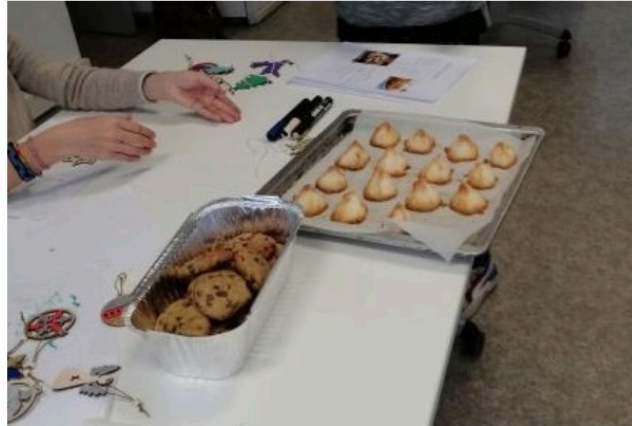
Atelier cuisine de Noël à Vic Accueil !

Il y a quelques semaines, nous vous avons présenté l'atelier « masques » organisé par Vic Accueil.