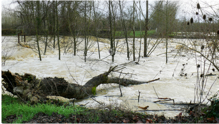
Crue inondation : point sur les routes départementales à 16 h 30

Le point aussi des agents du Conseil Départemental qui sont intervenus