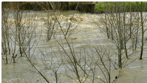
Les flots tumultueux du Gers à Preignan.