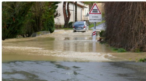
Un automobiliste qui prend des risques au moulin du Rambert.

Au total les équipes du Département ont effectué 120 interventions depuis le déclenchement de l'alerte.