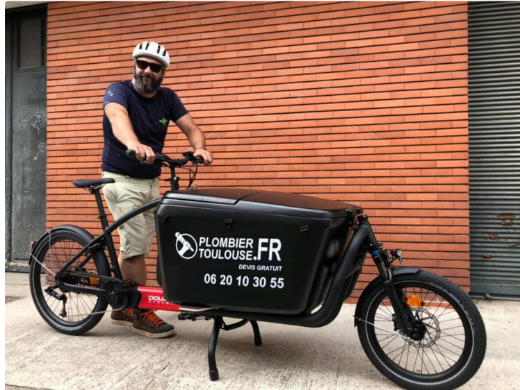
JHOG et les vélos cargos électriques professionnels

La mobilité douce adaptée aux entreprises et artisans