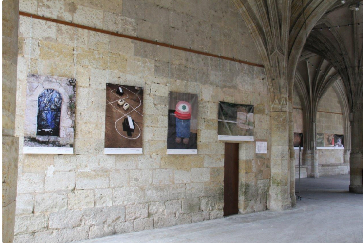
Un message d'espoir de la part de l'équipe des Chemins d'Art en Armagnac

Avec la confirmation de la 11e édition des Chemins d'Art en Armagnac : 4 artistes choisis en 2020 pour 4 lieux à la fois chargés d'Histoire, mais aussi de poésie et d'humanité.