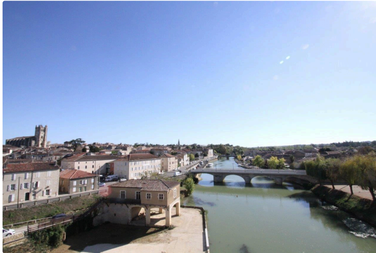
24 Petites Villes de demain sélectionnées dans le Gers

Ce dispositif de revitalisation veut favoriser des dynamiques de transition