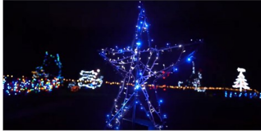
La magie de Noël en lumières chez la famille Duprat à Cassaigne

En ce mois de décembre, la télévision nous abreuve de reportages sur les villes ou villages illuminés au moment des fêtes.