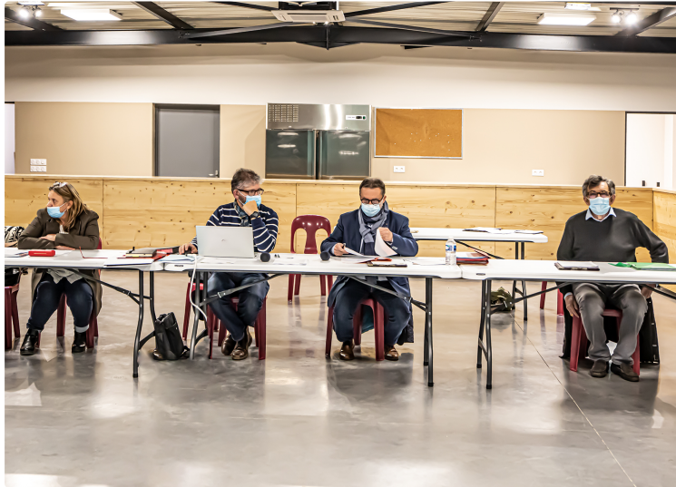
Un PLU orienté vers l'avenir pour Nogaro

Construire et attirer de nouveaux habitants sans gaspiller l'espace