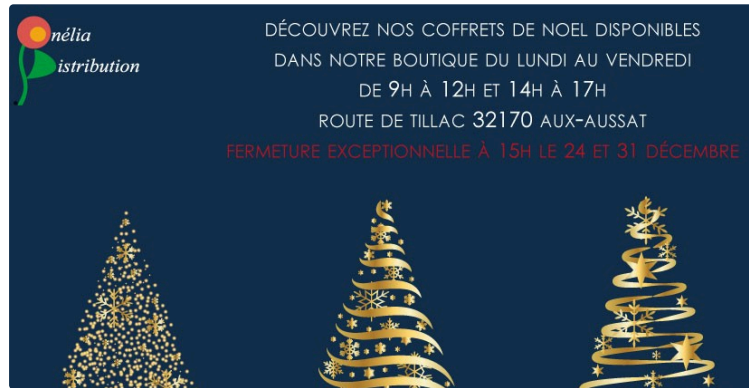
Onélia Distribution : la boutique de Noël à l'italienne.

Depuis près de 25 ans, l'entreprise Onélia Distribution, installée à Aux-Aussat, est spécialisée dans la distribution de produits alimentaires aux saveurs italiennes.