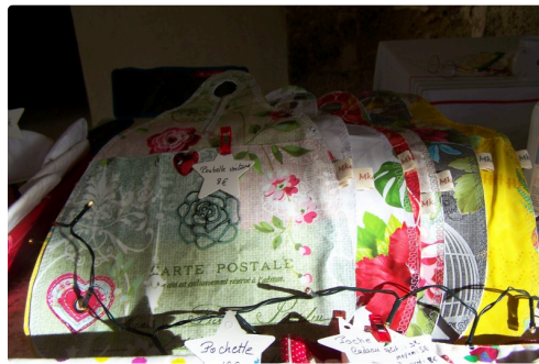
Quelques travaux d'ouvrage