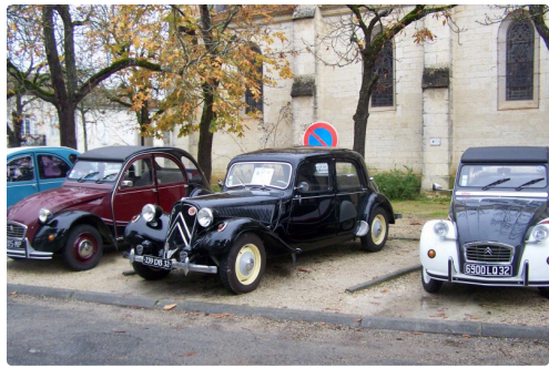
Et bien sûr l'exposition des 2 chevaux