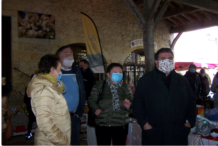
Un marché de Noël dans la tradition

Pour qu'un marché de Noël soit réussi, il faut quelques ingrédients, tout d'abord une bonne dose de soleil, puis il faut saupoudrer d'une ambiance musicale adaptée à cette période festive mais compliquée, mélanger un vaste choix de stands, ils étaient environ une quarantaine. Avec les artisans d'art et de bouche, ainsi que les associations qui ont proposé des idées de cadeaux variés. On retrouvait les jolis jouets en bois, des bijoux, des décorations de Noël, poteries, savons artisanaux, gourmandises bien tentantes sucrées ou salées, de l'artisanat du monde, produits de beauté et livres pour petits et grands, en fait, c'est une façon de se faire plaisir et de soutenir le travail des artisans locaux.