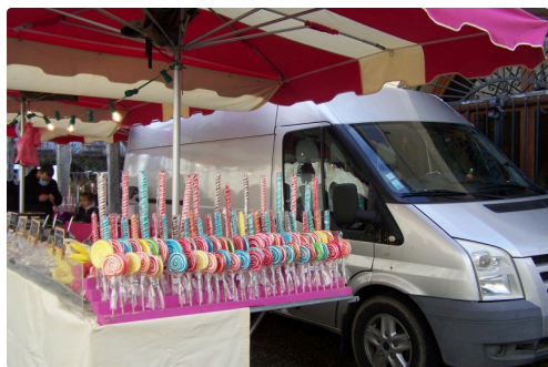
Friandises à gogo