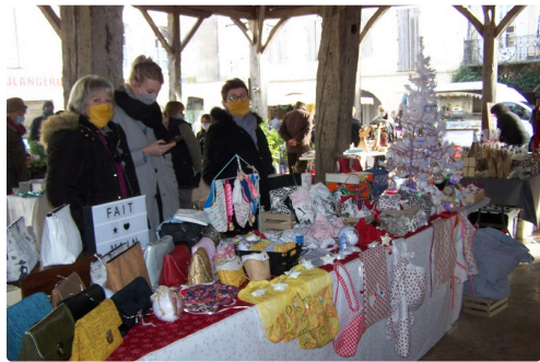
Un stand d'objets variés