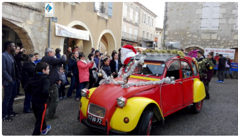
Sans oublier la star du moment " Le Père Noël", une photo prise à une autre époque, où nous n'avions jamais entendu parler du Coronavirus !