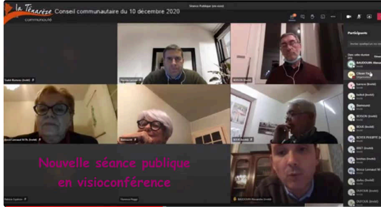
La CCT garde espoir pour une IRM dans la Ténarèze

Le Journal du Gers revient sur la dernière séance du conseil communautaire en date du jeudi 10 décembre.