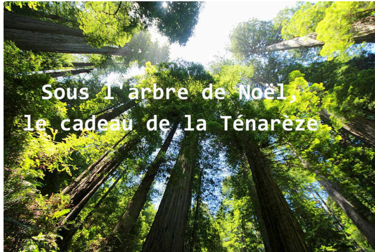
Région Occitanie : un seul groupement lauréat de l'appel à projets Séquoia

Celui composé de la Communauté de communes, du Centre intercommunal d'action sociale et d'un rassemblement de 24 communes de la Ténarèze