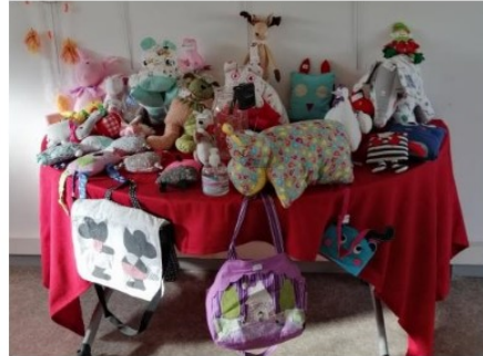
Les ateliers créatifs de Vic Accueil s'exposent

Samedi 5 décembre, Vic Accueil avait ouvert ses portes à l'occasion d'une expo-vente des objets réalisés dans le cadre des ateliers créatifs adultes.