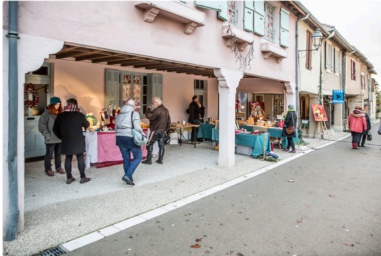
Marché de Noël à Lupiac ce samedi 12 décembre

Avec un trentaine de commerçants et artisans