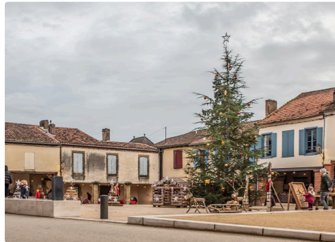
Coin de la place - Photo de 2018