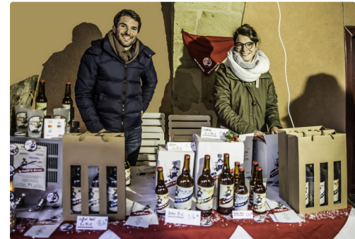
Bière artisanale - Photo de 2017