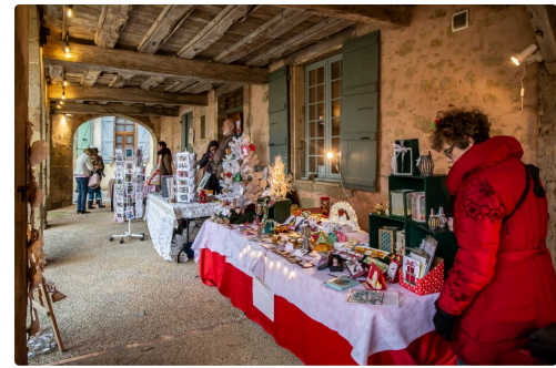
Sous les couverts - Photo de 2018