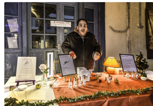
Le parfumeur - Photo de 2017