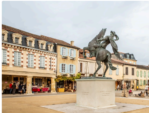
Statue équestre de d'Artagnan - Photo de 2018

N.B. - La photo du haut de page a été prise en 2017.