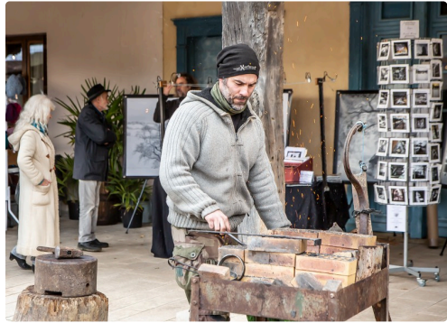
Le forgeron - Photo de 2018