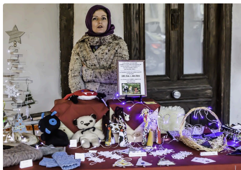
Vente de doudous de récup pour les vieux chevaux - Photo de 2017