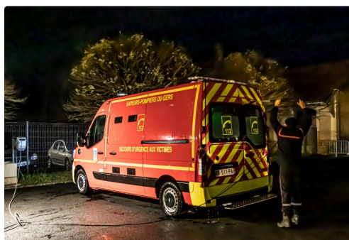
Le VSAV est soigneusement lavé...