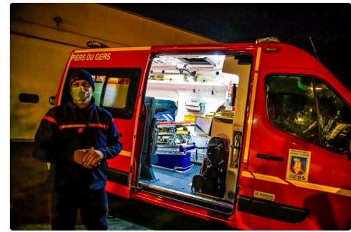
Vu de côté