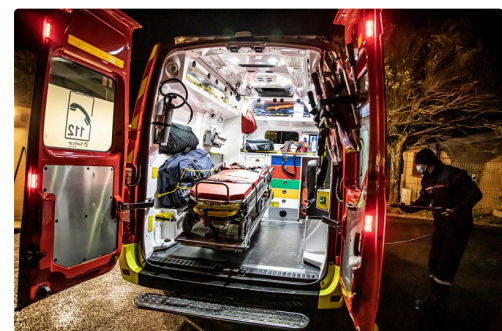
Vu de l'intérieur