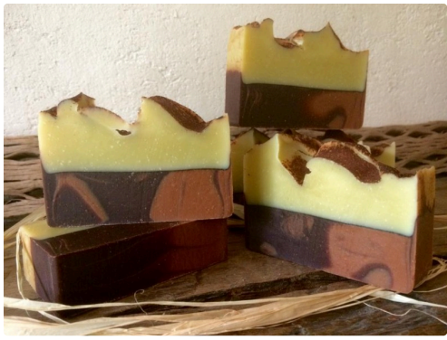
De la bûche de Noël ? Non, du savon !