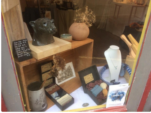
La boutique éphémère à Auch