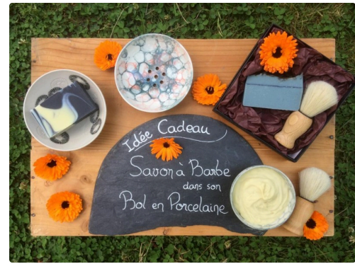
Pour vous messieurs