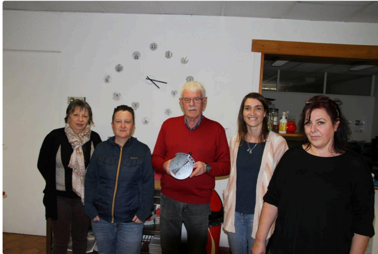
L'Ecocombu, un produit breveté Made in Gers

Vous allez économiser sur votre bois et pourtant vous allez chauffer plus !