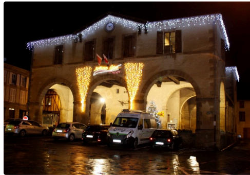
Mielan 07122020 (10) [1280x768].JPG