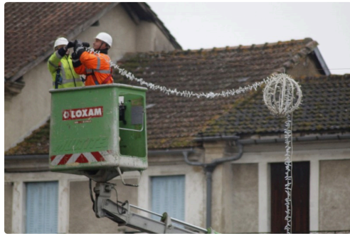
Installation des guirlandes.

Les guirlandes ont beaucoup évolué dans le temps. L'ampoule classique a été délaissée au profit de LED basse consommation dont le déclenchement se fait par détecteur crépusculaire.