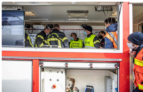
Point de situation et prévisions