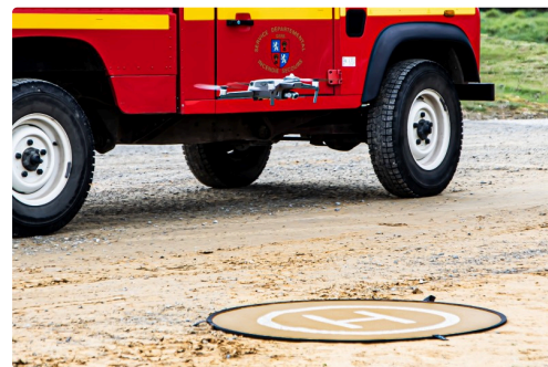
Il va atterrir