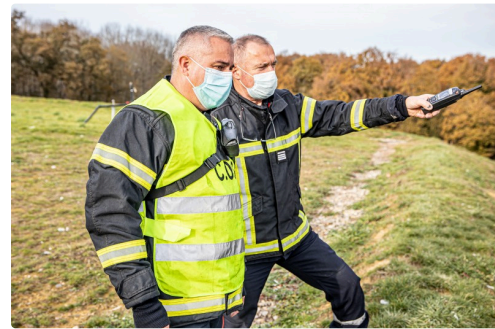
Il étudie le terrain de l'incendie en contrebas