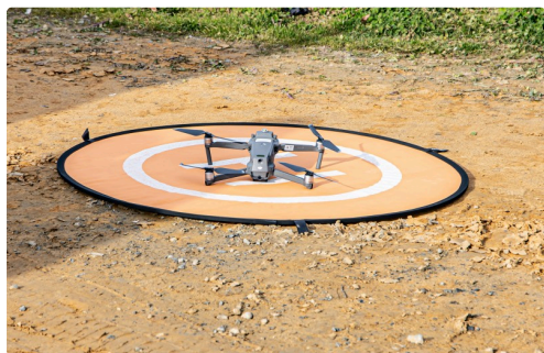
Le drone va décoller pour une reconnaissance