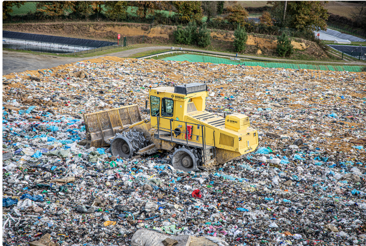
« Incendie » maîtrisé au centre d'enfouissement du Houga

Un exercice de cadres des sapeurs-pompiers en liaison avec Trigone