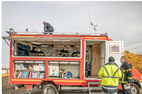
Installation du camion PC

(1) Trigone est le service public du Gers chargé du traitement des déchets des ménages des habitants du Gers, de la production et de la distribution d'eau potable et de l'assainissement collectif et non-collectif. (2) Un exercice de cadres est destiné à entraîner les cadres à prendre des décisions, à rendre compte et à réagir aux incidents fictifs introduits par le commandement. Il n'y a pas d'exécution réelle. (3) Le compacteur en question est une sorte de tracteur-bulldozer avec des rouleaux compresseurs armés de dents en guise de roues. Il est destiné à casser les déchets et à les tasser.