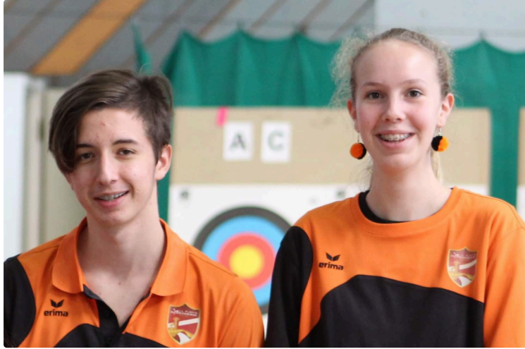
Tir à l'Arc de l'Isle-Jourdain : les jeunes assurent la relève à la Flèche Gasconne