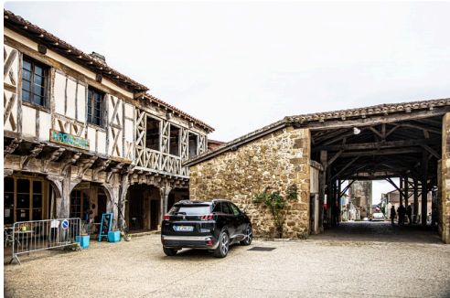
La halle de Bassoues