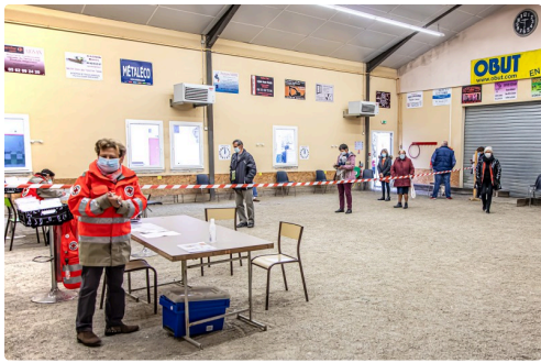
Accueil pour le test à Aignan