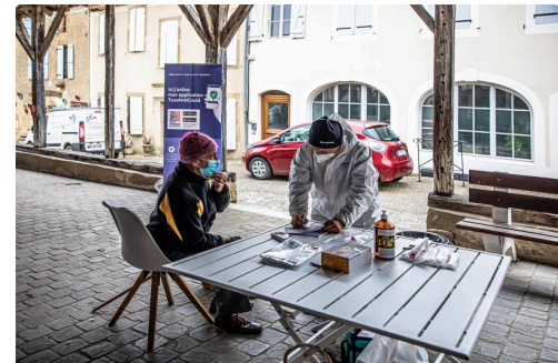
Prise en charge à Bassoues