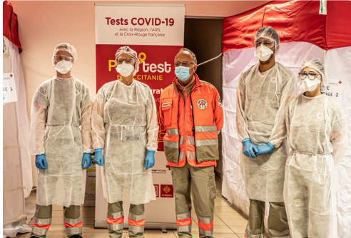
L'équipe de dépistage à Aignan