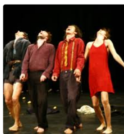
Crida company en ouverture