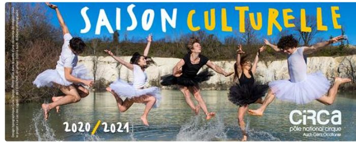
Bonne nouvelle ! Circa et les arts de la piste dès le 15 décembre...