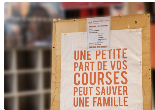
Affiche de la Banque alimentaire