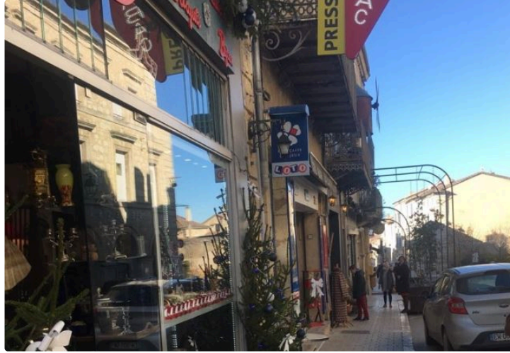
Enfin de bonnes nouvelles avec les informations de l'ACAL